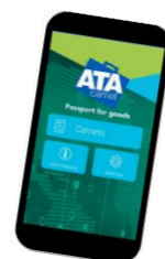
デジタルカルネイメージ

上記システムリニューアル後は、ご入力いただくカルネの申請書式の入力項目等が一部変更となります。この変更は、現在、ICC（国際商業会議所）及びWCO（世界税関機構）を中心として世界規模で進められているATAカルネのデジタル化に先立ち、カルネに記載される内容を世界統一様式に合わせることを目的としております。