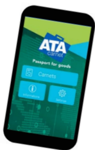
デジタルカルネイメージ

上記の変更は、現在、ICC（国際商業会議所）及び WCO（世界税関機構）を中心として世界規模で進められている ATA カルネのデジタル化に先立ち、カルネに記載される内容を世界統一様式に合わせることを目的としたものです。お客様にはご迷惑をお掛けいたしますが、何卒ご理解の程、お願い申し上げます。